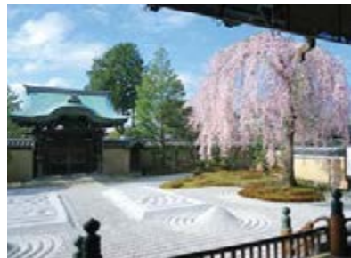
코다이지 절 MAP 10 도요토미 히데요시의 부인 네네가 남편의 내세를 기원하기 위해 건립한 사원입니다. 봄에는 벚꽃, 가을에는 단풍이 아름다워 야간 라이트업도 실시하고 있습니다.