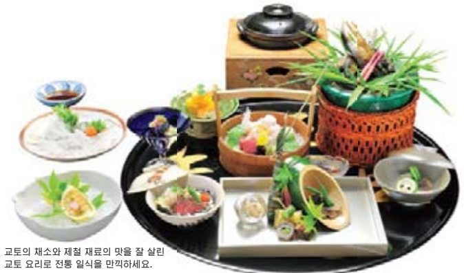
교토의 채소와 제철 재료의 맛을 잘 살린 말차를 달콤한 디저트로 즐기실 수 있습니다.