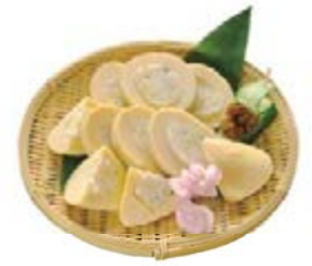
일본의 봄을 대표하는 식재료 죽순은, 여러가지 요리로 맛보실 수 있습니다.