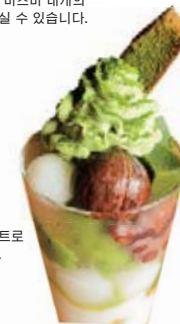
일본차를 대표하는 말차를 달콤한 디저트로 즐기실 수 있습니다.