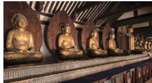
쥬류리지 절 MAP 4

우지 타와라조에서 차를 재배했던 나가타니 소엔이 1738년 개발한 제조기법. 손으로 찻잎을 비벼서 우수한 전차(煎茶)를 만드는 이 기법은 지금까지도 이어지고 있습니다.