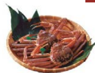
'바다의 교토'에서는 마즈바 대게의 훌륭한 맛을 느껴보실 수 있습니다.