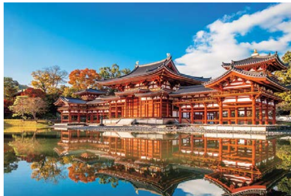
묘도인 절 MAP 2

차밭의 풍경을 접할 수 있는 '차(茶)의 교토' 지역, 그 중에서도 '다원향'이라고 불리는 와즈카즈(和束町)는 우지차의 주요 생산지입니다. 산자락을 따라 펼쳐진 이시테라의 차밭은 그야말로 장관입니다.