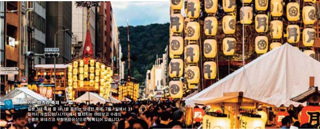
기온 마츠리 축제 MAP 10 일본 3대 축제 중 하나로 꼽히는 성대한 축제. 7월 1일에서 31일까지 개최되며, 시가지에서 펼쳐지는 야마보코 수레의 순행은 유네스코 무형문화유산으로 등록되어 있습니다.

천년 이상을 일본의 수도로 지내 왔던 교토부의 중심지. 절, 신사, 불상, 전각을 시작으로 축제와 문화 등, 긴 세월을 걸쳐 길러져 온 수도로서의 전통이 현대에도 살아 숨쉬고 있습니다. 오래되고 좋은 문화를 전하는 한편, 방문할 때마다 새로운 매력과 만날 수 있는 도시. 교토에는 한두 번의 방문으로는 알 수 없는 깊은 매력이 있습니다.