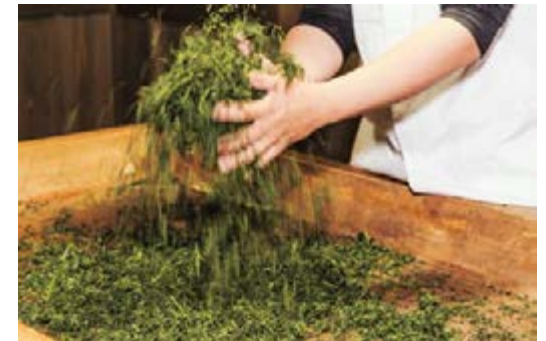
우지차 테모미 제조기법

우지 타와라조에서 차를 재배했던 나가타니 소엔이 1738년 개발한 제조기법. 손으로 찻잎을 비벼서 우수한 전차(煎茶)를 만드는 이 기법은 지금까지도 이어지고 있습니다.