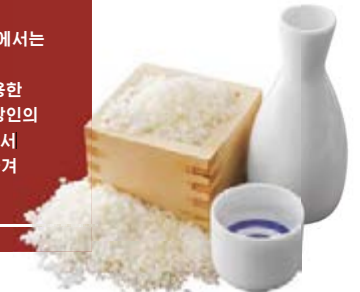
교토 각지에서는 오랜 역사를 가진 양조장들이 각각 특색 있는 사케를 생산하고 있습니다.

깨끗한 물과 비옥한 토양을 가진 교토에서는 독자적인 음식과 공예 문화가 발전하였습니다. 제철의 식재료를 이용한 여러 가지 요리와 깔끔한 맛의 사케, 장인의 기술이 스며든 기모노 등, 교토 각지에서 전해져 오는 특색 넘치는 물품도 꼭 즐겨 보십시오.