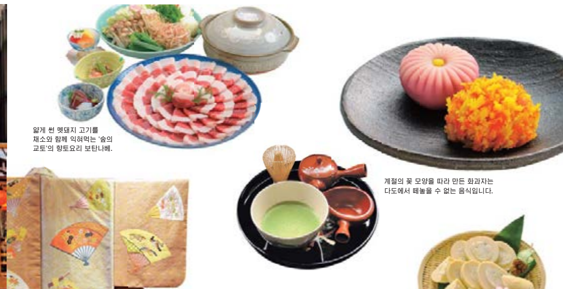
얇게 썬 멧돼지 고기를 채소와 함께 익혀먹는 '숨의 교토'의 향토요리 보탄나베.