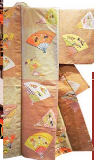
高级丝绸纺织品“西阵织”，自古便是和服及日式杂货常用的布料。

京都拥有优良的水质与肥沃的土壤，由此形成了独特的饮食及制造文化。多种活用食材原味的料理、口感清澈透彻的日本酒、匠人用精湛手工艺制成的和服等……欢迎您来体验京都各地富有特色的臻品。