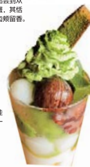
抹茶为日本茶的最佳代表，可搭配甜品一同品尝。