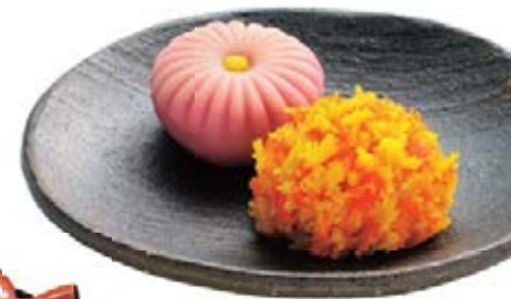
茶道中必不可少的和菓子，是按照当季花卉形状制作而成。