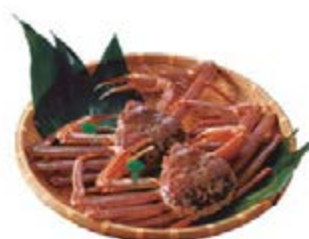
在海之京都，您能品尝到从日本海捕获的松叶蟹，其恬淡高雅的风味让人齿颊留香。