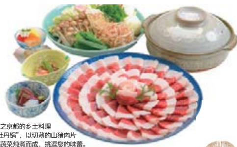
森之京都的乡土料理“牡丹锅”，以切薄的山猪肉片和蔬菜炖煮而成，挑逗您的味蕾。

*自2017年2月起，对本堂屋顶的桧树皮瓦进行整修，但本堂参拜与舞台参观仍对外开放。