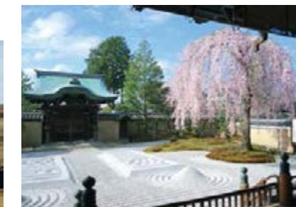
高台寺 MAP 20

16世纪叱咤风云的领袖丰臣秀吉的元配夫人宁宁，为祈求亡夫冥福而修建的寺院。春天樱花与秋天红叶时节，这里都会举办夜晚点灯的活动。