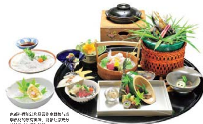
京都料理能让您品尝到京野菜与当地食材的原有美味，能够让您充分体验日式料理的精髓。