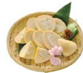
您可以通过各式各样的料理尽情品尝代表日本春季味道的竹笋的美味。