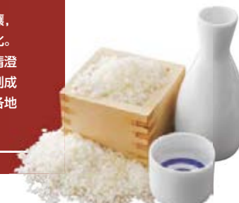
京都各地的历史悠久的酒藏，孕育出多种独具特色的日本酒。