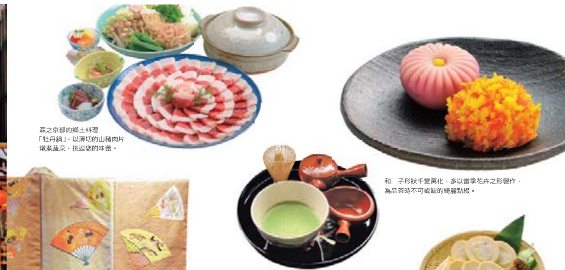
森之京都的鄉土料理「牡丹鍋」，以薄切的山豬肉片燉煮蔬菜，挑逗您的味蕾。

* 自 2017 年 2 月起，本寺進行本堂檜皮屋頂的替換工程，但本堂與舞台仍開放參觀。