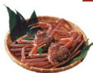
在海之京都，能品嚐日本海捕獲的松葉蟹，恬淡高雅的風味讓人齒頰留香。