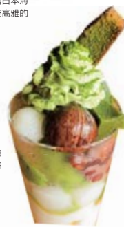
抹茶為日本茶的最佳代表，作為甜點品嘗也別有一番風味。