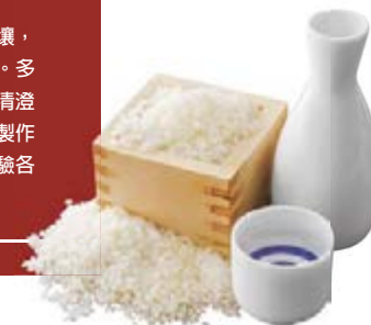
京都各地有多處歷史悠久的酒藏，孕育出多種具有特色的日本酒。

京都受惠於優良的水質與肥沃的土壤，因此發展出獨特的飲食及手作文化。多種活用時令食材原味的料理、口感清透徹的日本酒、職人以精湛的手藝製作的和服……請務必來京都一趟，體驗各式各樣帶有當地特色的文化產品。