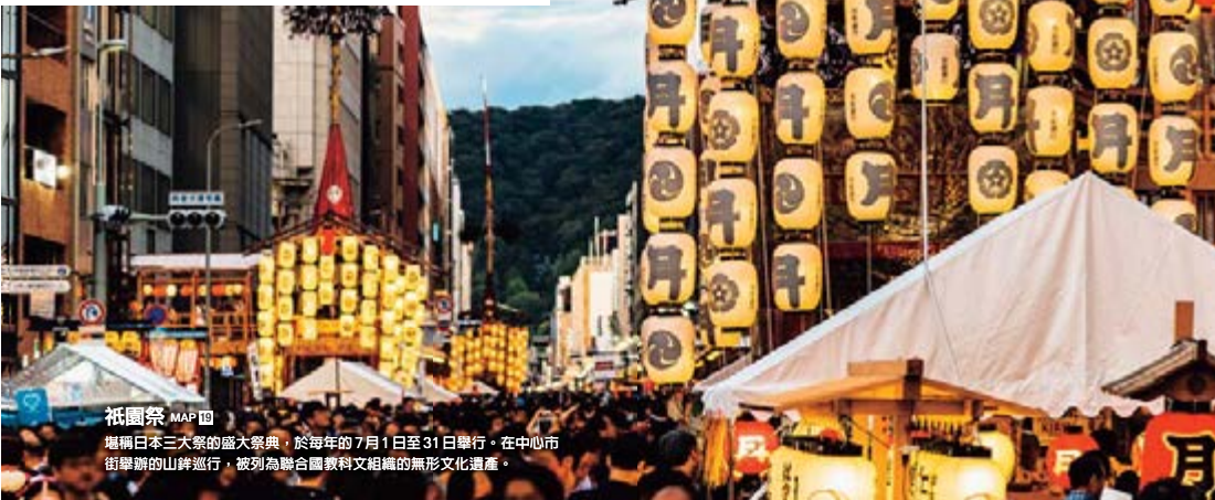
祇園祭 MAP 四 堪稱日本三大祭的盛大祭典，於每年的 7 月 1 日至 31 日舉行。在中心市街舉辦的山鉾巡行，被列為聯合國教科文組織的無形文化遺產。

京都府的中心地區，曾維持「日本首都」的名號 1000 多年。不僅是寺院神社佛閣，各式祭典與文化等積年累月孕育出的古都傳統，至今仍發揮偌大的影響力。而不僅是古老優良的傳統文化，每次造訪都能在市街上有嶄新的發現。屬於千年古都的神秘魅力，值得您多次走訪發掘。