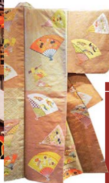
高級絹織品「西陣織」，自古即為和服及和式雜貨常用的布料。